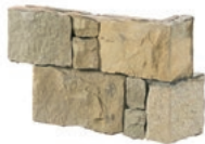
L. ± 34.5/14.5 x h. 22 x ep. 4 cm L. ± 22.3/22.3 x h. 11 x ep. 4 cm